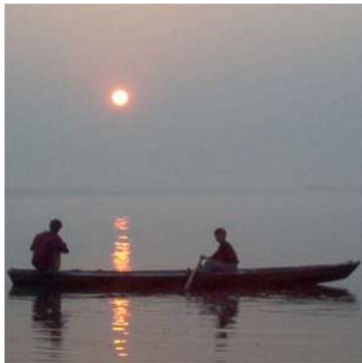
Morgenstimmung am Ganges

Diese Einladung richtet sich an Menschen mit Erfahrung in Meditation, Körperarbeit und Kommunikation, die im Austausch mit Menschen in der Reisegruppe und in Selbstreflexion ihre persönliche Lebenserfahrung und ihr Bewusstsein erweitern möchten.